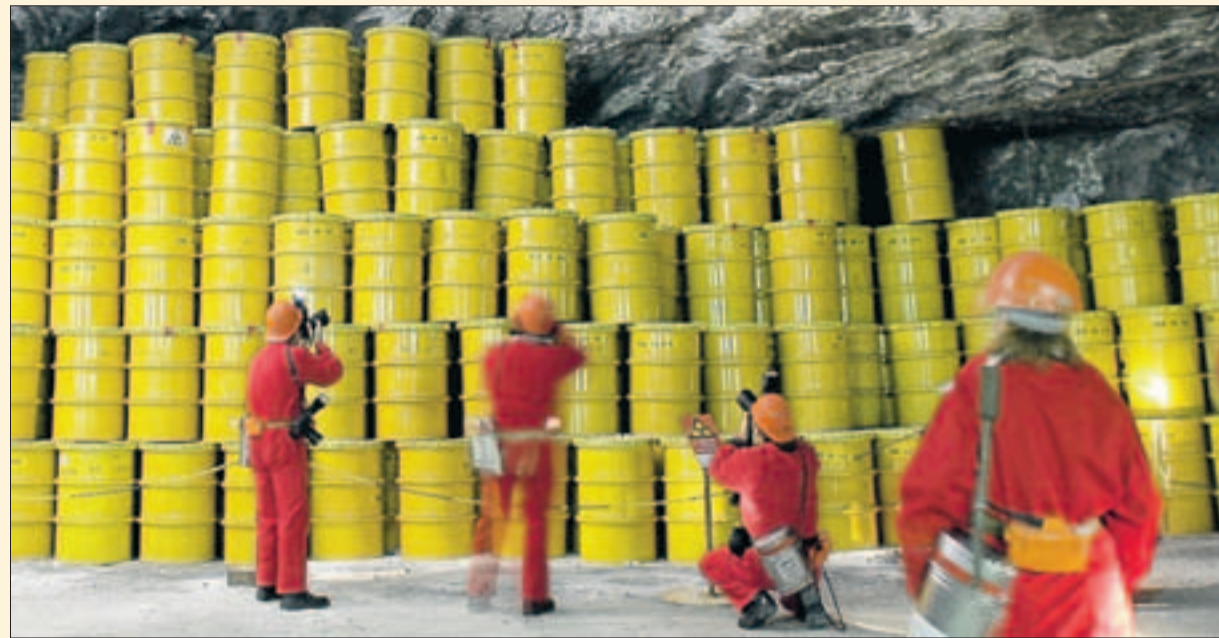
Im Atommülllager Morsleben liegt schwach- und mittelradioaktiver Müll – insgesamt 37 000 Kubikmeter: zum Beispiel belasteter Bauschutt, Erde, Lösungen, Metallschrott und Schutzkleidung. Auch Radium mit langer Verfallszeit ist unter den Abfällen, ebenso Uran und Kobalt.