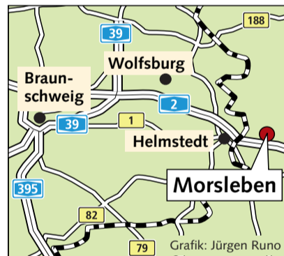
Das Atommülllager liegt direkt hinter der Landesgrenze in Sachsen-Anhalt.

Viele von ihnen fordern, dass zumindest ein Teil der radioaktiven Abfälle herausgeholt wird, und dass Alternativen zum Verfüllen mit Beton noch genauer untersucht wer-